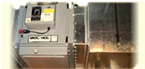
● 高効率電気集塵機 SMOG-HOG SH-PP-11D